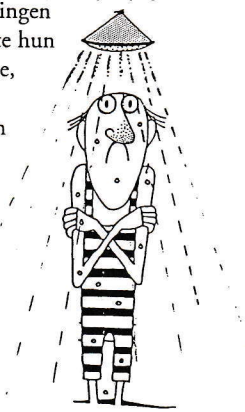
Van koude douche ...

Een derde probleem was dat de docenten van de taalschool enerzijds en de beroepsopleidingen anderzijds niet in de gelegenheid werden gesteld elkaar te ontmoeten. Als er contacten waren, was dit op persoonlijk initiatief en in de eigen tijd. Men had mede daardoor weinig zicht op wat er op het andere instituut werd gedaan. Van een